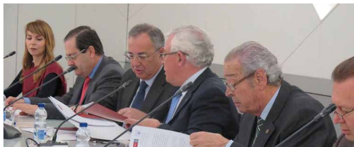
Un momento de la firma del convenio.

Las obras, de tema libre, deberán ser inéditas, no debiendo haber sido publicadas ni total ni parcialmente, ni haber sido premiadas en ningún otro concurso, certamen o actividad literaria, no solamente en la fecha de su admisión al concurso, sino en el momento de la proclamación del fallo, debiendo enviar cada participante una sola obra original y una copia de la misma. No se admite más de una obra por autor.