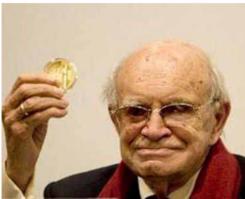
Ramón Xirau.

Antes de dar lectura a algunos de los poemas del nonagenario escritor, Cross explicó por qué eligió los que tienen que ver con el mar. "En Ramón el mar siempre parece ser el Mediterráneo —aunque hay referencias a otros mares—, si nos guiamos por los elementos de una posible descripción, pero más allá de ésta, ese mar es en sí mismo no sólo un lugar del tiempo, sino un lugar sin tiempo; es un lugar donde concurren la memoria, el sueño y el deseo; un mar desnudo, esencial".