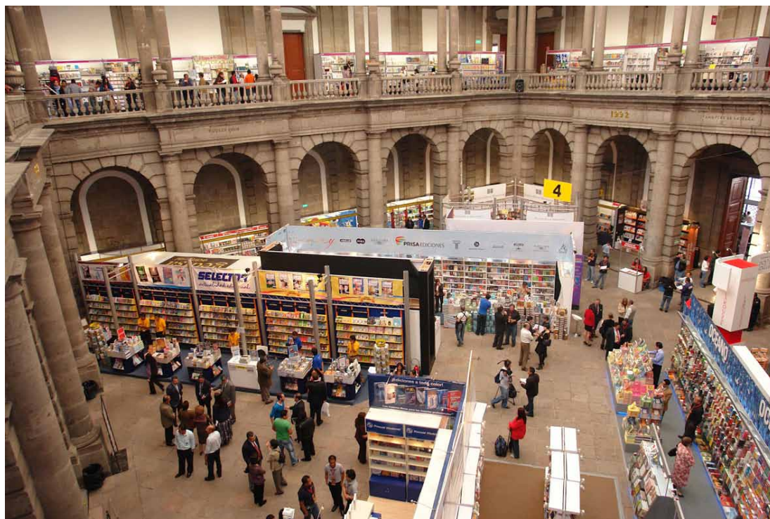
Feria Internacional del Libro del Palacio de Minería.

Este es sin duda el espacio adecuado para comentarles la urgente necesidad de que nuestras autoridades valoren los libros, sus contenidos y la labor de nuestros creadores. No podemos seguir, si queremos ser un país digno, con la costumbre –de alguna manera hay que llamarla –de, por ejemplo, construir bibliotecas pero luego no tener presupuesto para sus acervos; de comprar equipamientos tecnológicos pero no poder pagar por los contenidos que los hacen útiles; de iniciar programas de fomento a la lectura o de prevención de la violencia con donativos y, muchos otros. Es hora de que llenemos los espacios – tanto físicos como virtuales – que se dedican al libro no con sobras. Llenémoslos con obras.